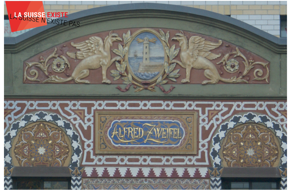
Lenzburg, Fassade der Malaga-Kellerei (Aufnahme: Francine Giese, 2016).