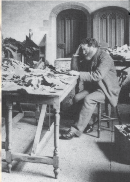
Img. 1: Photo of T. Schechter studying the Cairo Geniza documents (taken in 1895).